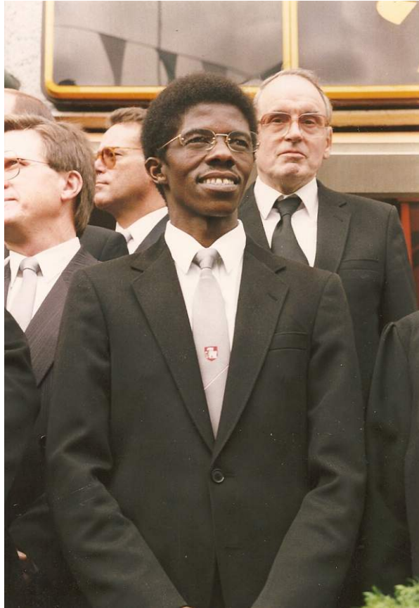
Schützenfest 1988 - Abnahme der Parade, Grevenbroich-Stadtmitte, Fußgängerzone -