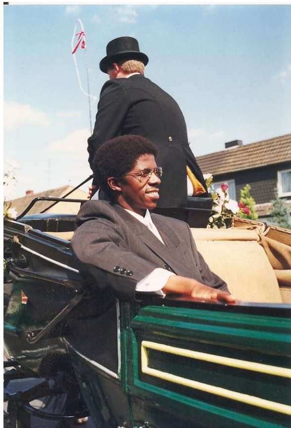
Schützenfest 1990 „die Geistlichkeit“ in der Kutsche zur Abholung der „Majestäten“ vor Abnahme der Parade