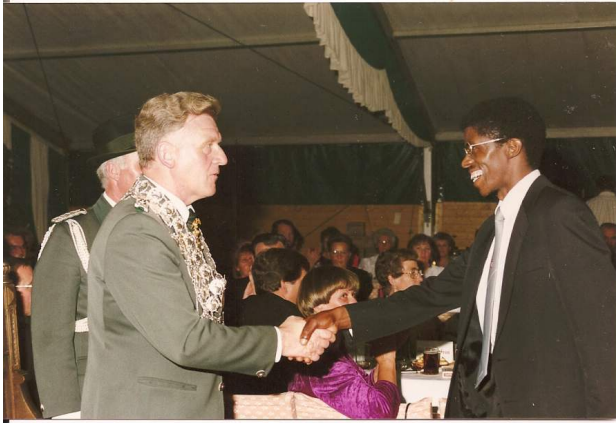
Schützenfest 1988 Nach der Festrede am Krönungsabend den „Majestäten“ gratulieren im Festzelt, Grevenbroich-Stadtmitte