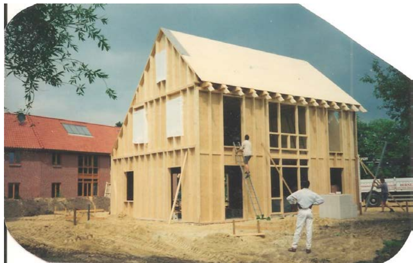
Freitag, 13.06.1997: Das Haus steht!