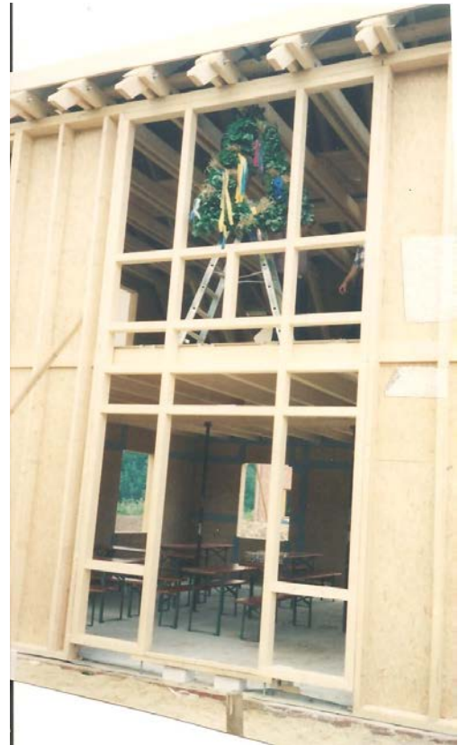
Die Richtkrone prangt am Galeriefenster