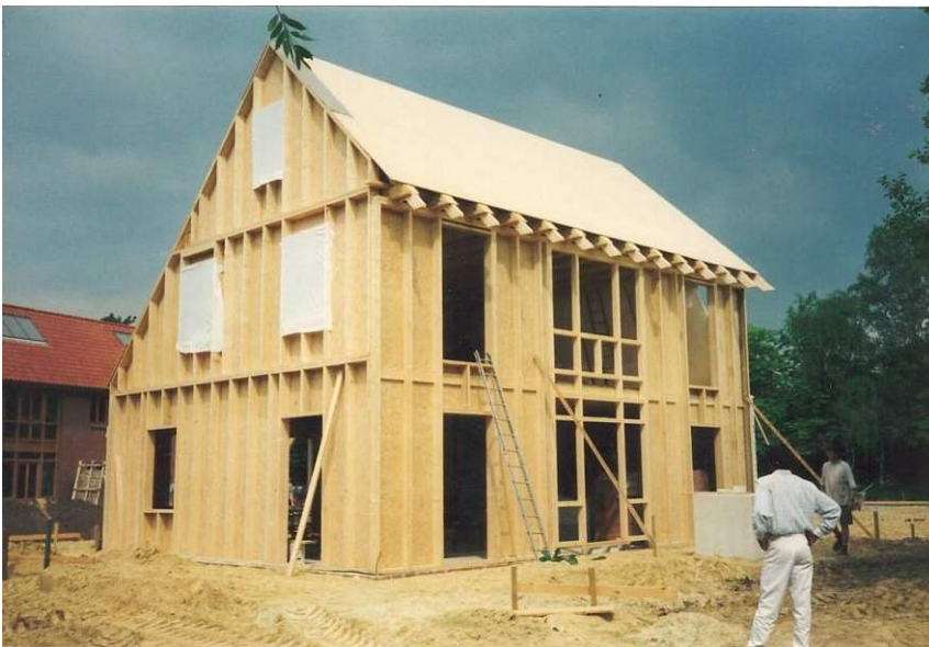
Freitag, 13.06.1997, 14:00 Uhr: Baustelle (heute: Alte Ziegelei 4)