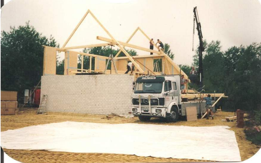
Freitag, 13.06.1997, 09:00 Uhr: Baustelle (heute: Alte Ziegelei 4)